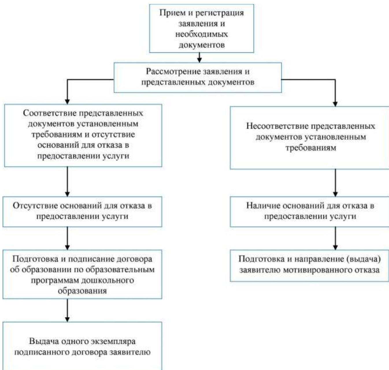
Блок-схема предоставления муниципальной услуги в части зачисления в МДОУ